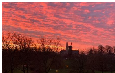
Zonsopgang 11 januari 2022