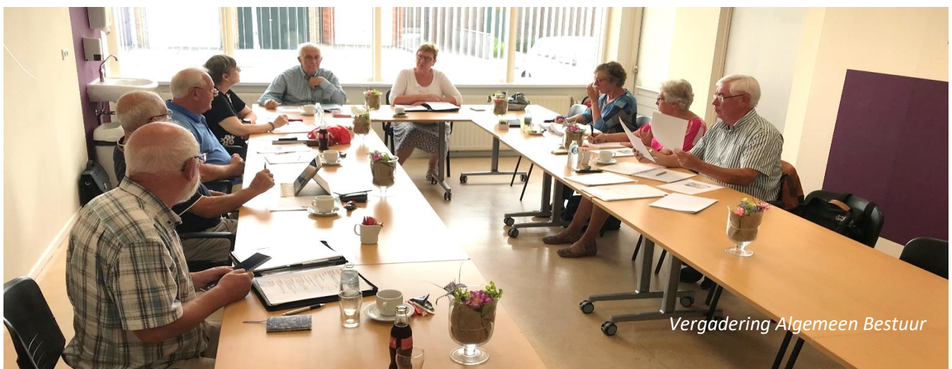
Vergadering Algemeen Bestuur